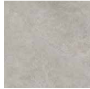
Crosscut Dark grey / Koyu gri