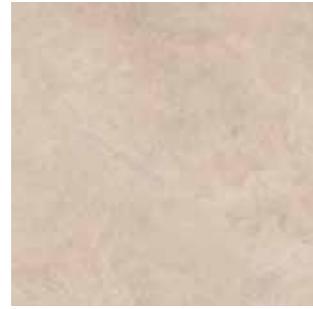
Crosscut Dark greige / Koyu grej