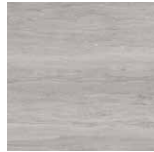
Veincut Dark grey / Koyu gri