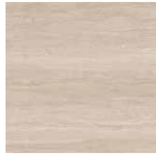
Veincut Dark greige / Koyu grej