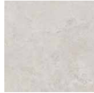
Crosscut Light grey / Açık gri