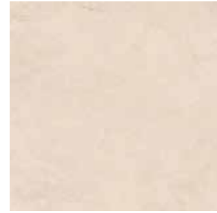
Crosscut Light greige / Açık grej