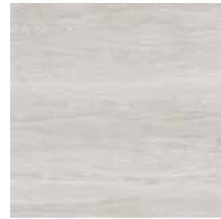
Veincut Light grey / Açık gri