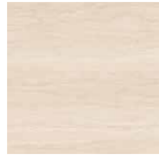
Veincut Light greige / Açık grej